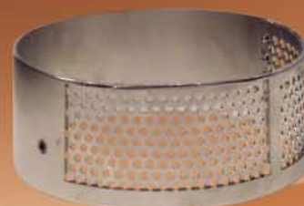
Grinding unit GRI130 two sizes 2-3/3-4/5-6/